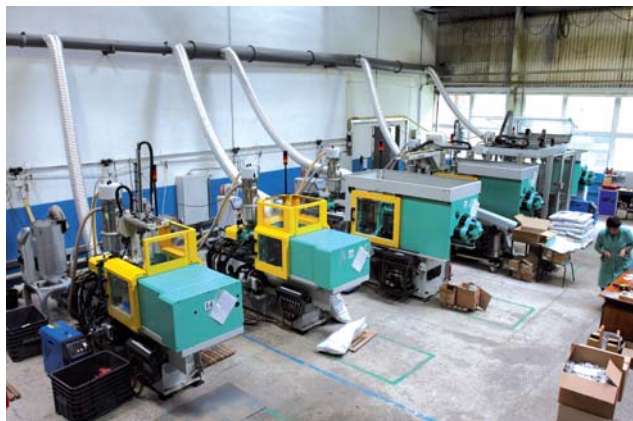
Цех производства пластиковых деталей