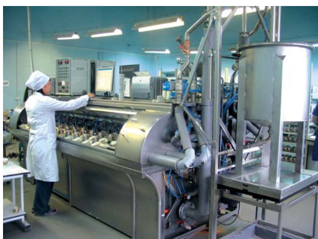
Цех проливки и калибровки